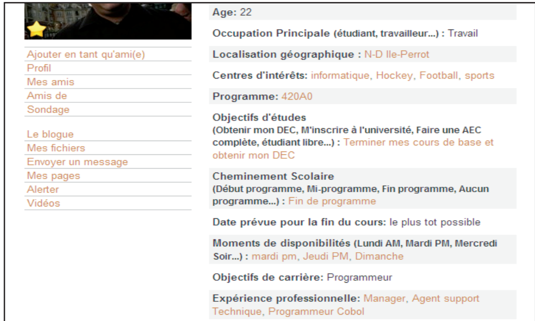
Figure 1. Éléments du profil pour rechercher un pair