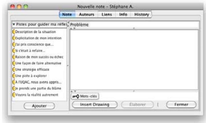
Figure 1. Balises proposées pour guider la réflexion des participants sur le forum électronique

mises à l'essai dans d'autres contextes de formation à l'enseignement (Allaire, 2006; Allaire et Hamel, 2009).