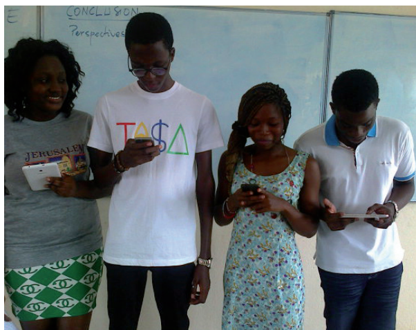
Figure 3. Image d'une observation directe de classe : utilisation de téléphones mobiles et de mini-tablettes pour exposer un travail collaboratif.

Les avis exprimés par les répondantes ici ne dévoilent pas non plus des usages convaincants des supports mobiles, si ce n'est de traduire leur « envie » et leurs « attentes » en termes d'autorisation et de démocratisation de l'utilisation des supports mobiles dans les universités pour supporter et soutenir l'enseignement, l'apprentissage et l'évaluation des savoirs, des savoir-faire, des savoir-être, etc.