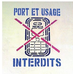
Figure 1. Image portant interdiction des téléphones portables à l'école au Bénin.

Mieux, selon Kiyindou et Bautista (2011), l'individu n'a de cesse d'intervenir, de ruser, de s'accommoder, de transformer le réel, de changer les lois, d'inventer des règles, de s'arranger avec la vie.