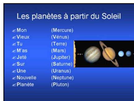
Figure 2. Exemple de diapositive faisant appel aux principes de mnémotechnie.